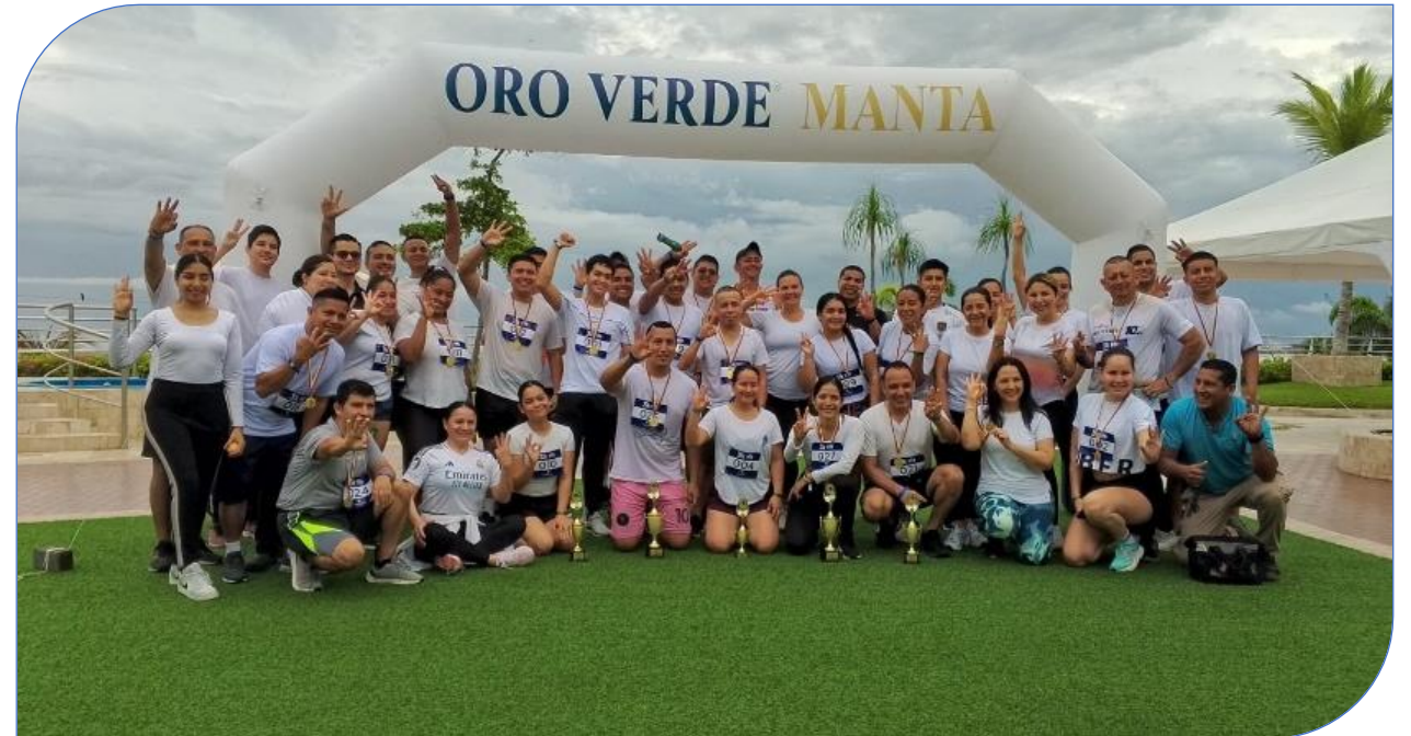
Ganadores Carrera 3k